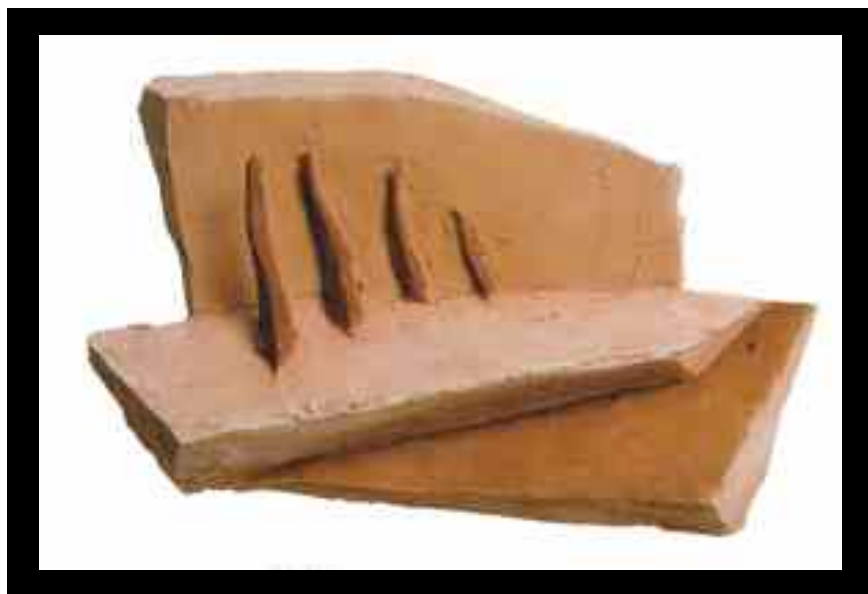
DRVORED 2012. ( 28 X 46 ) TERAKOTA