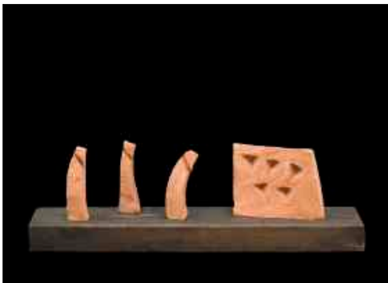
DEČKI IDU U ŽIVOT 2006. ( 40 X 68 ) TERAKOTA