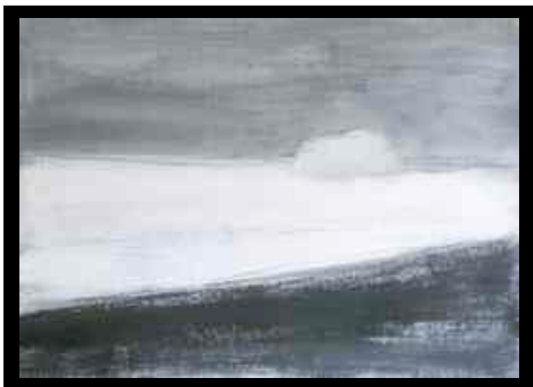
ZIMSKA RAVAN 2010 ( 50 X 70 ) KOMB. TEHNIKA