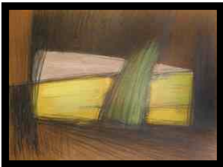
TRAVA 2010 ( 50 X 70 ) KOMB. TEHNIKA