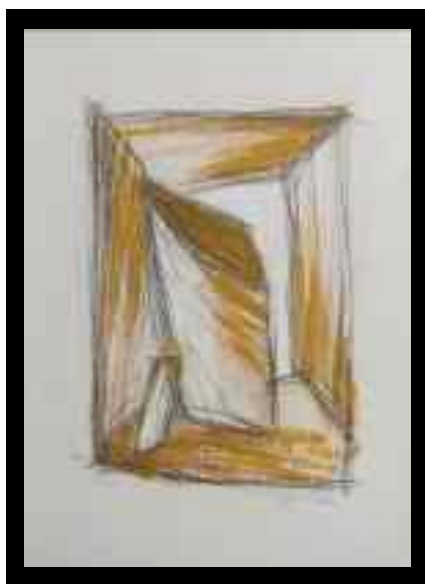
VELIKI BRAT III. 2010. ( 29,5 X 23,5 ) KOMB. TEHNIKA