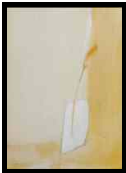
CVIJET 2012. ( 29,5 X 21 ) KOMB. TEHNIKA