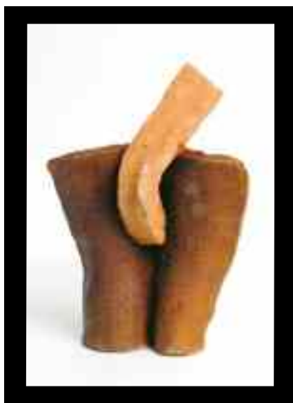
PUPOLJAK II. 2012. ( vis. 22 ) TERAKOTA