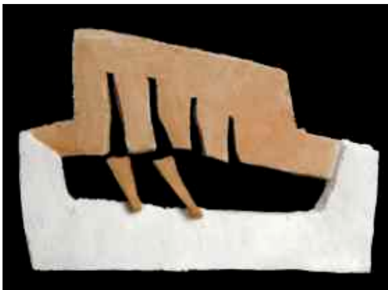
ZIMSKJE SJENE 2012. ( 38 X 59 ) TERAKOTA