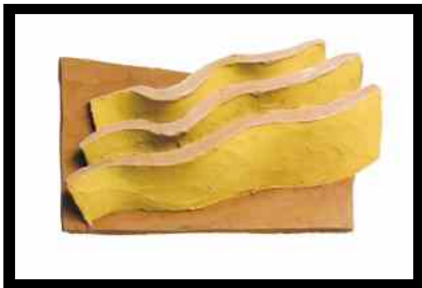
VJETAR 2012. ( 25 X 41 ) TERAKOTA