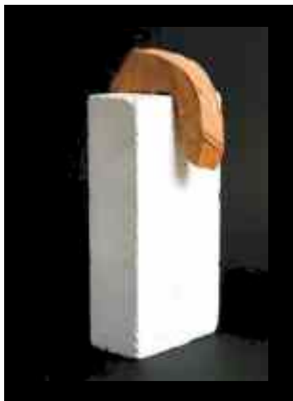
POSRNULI UMOČKO 2006. ( vis. 30 ) TERAKOTA