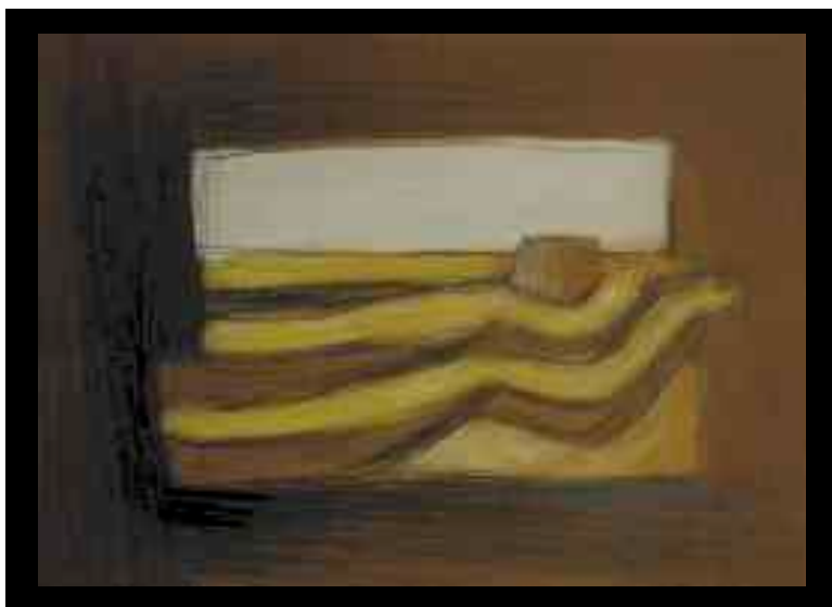
USAMLJENI 2010. ( 50 X 70 ) KOMB. TEHNIKA